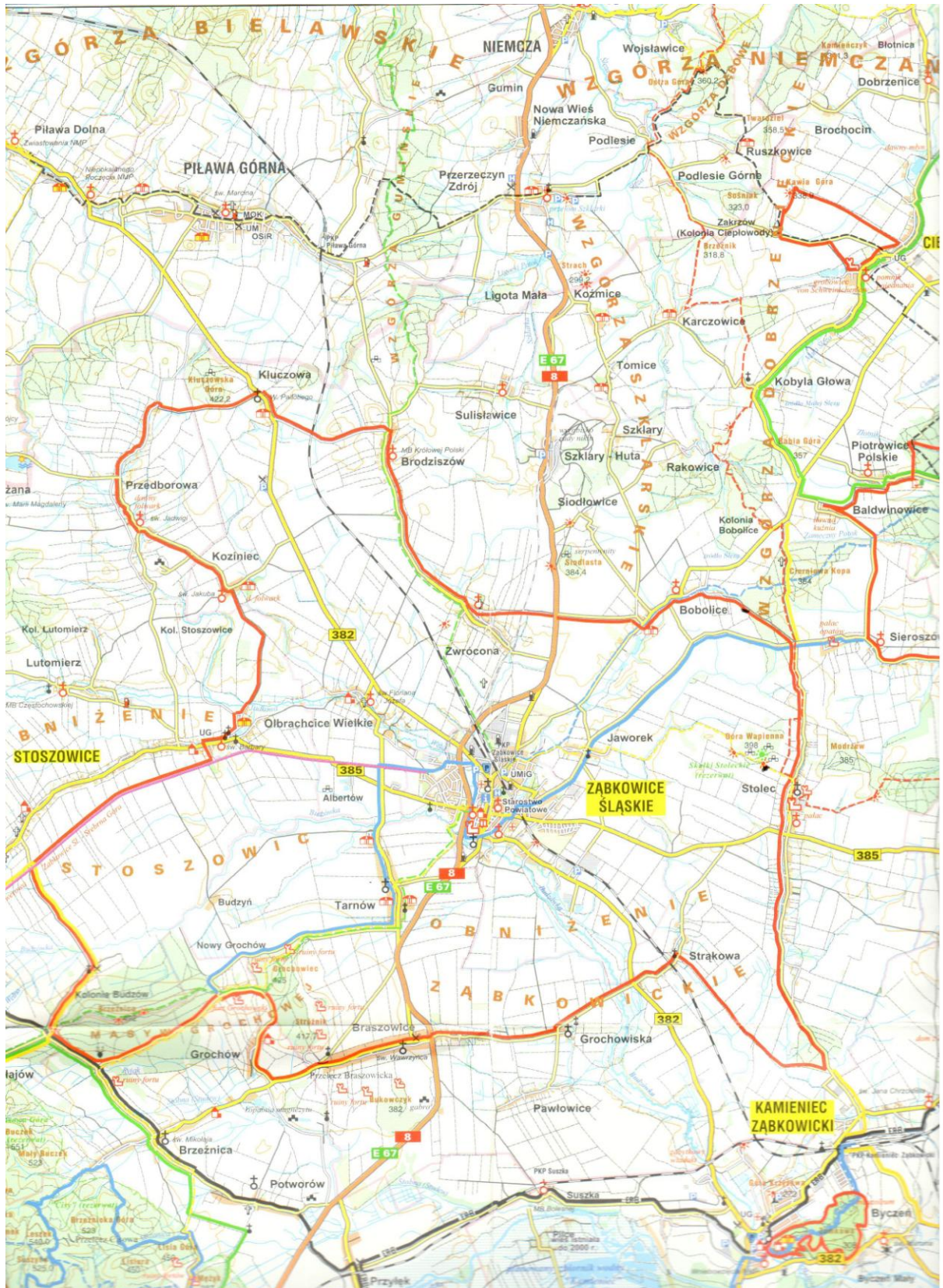
Ryc. 2 Stolec na tle Gminy Ząbkowice Śląskie

Gmina Ząbkowice Śląskie położona jest w całości na bloku przedsubdeckim obejmuje fragmenty trzech dużych jednostek tektonicznych: