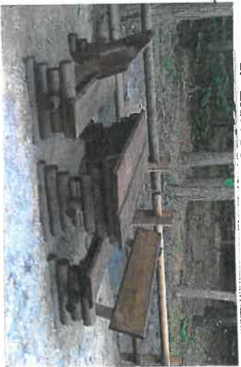
1. ŁAWOSTÓŁ DREWNIANY