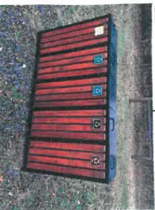
4. KOSZ NA ŚMIECI DO SEGREGACJI ODPADÓW