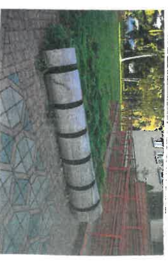
5. STOJAK NA ROWERY Z BALA DREWNIANEGO