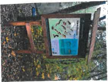
3. TABLICA INFORMACYJNA