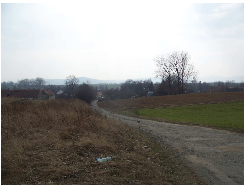
Ryc. 6 Ukształtowanie terenu – widok w kierunku południowym