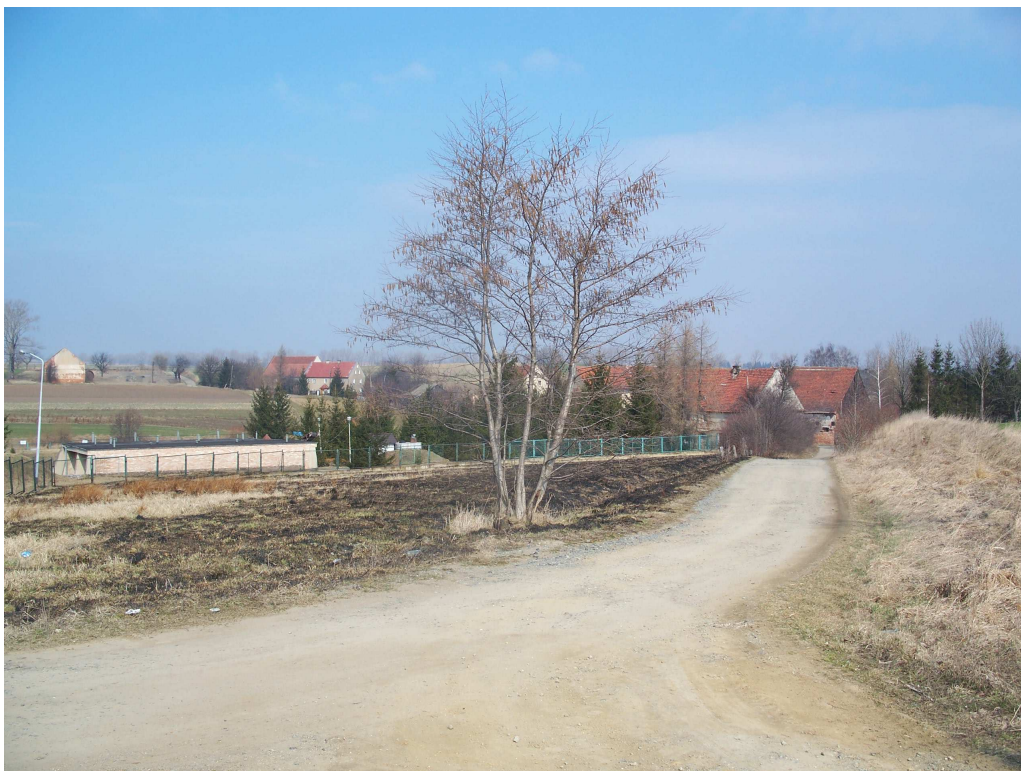
Ryc. 3 Ukształtowanie terenu – widok od strony zachodniej