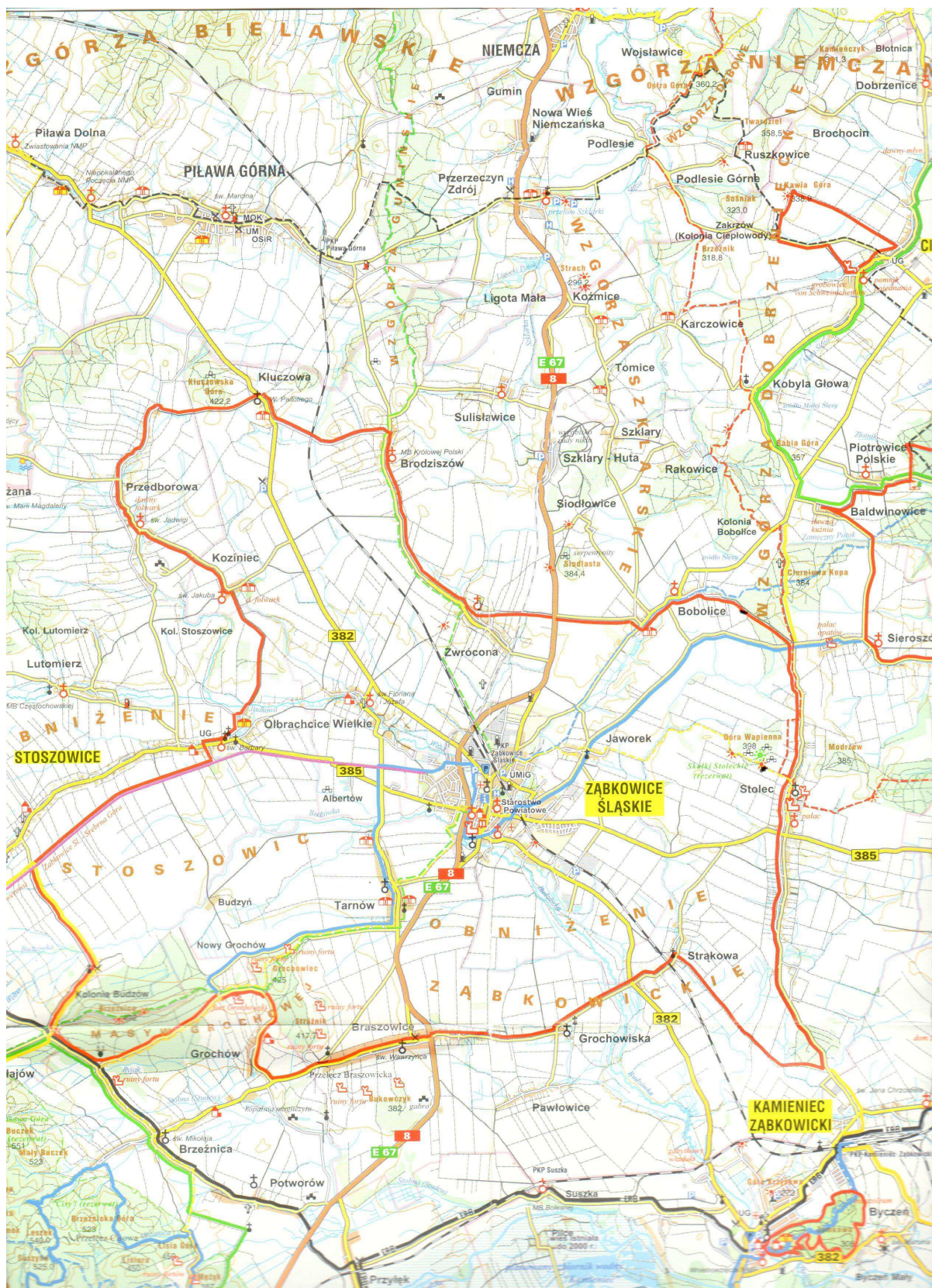
Ryc. 2 Olbrachcice Wielkie na tle Gminy Ząbkowice Śląskie