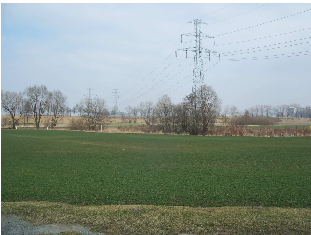
Ryc. 4 Ukształtowanie terenu – widok w kierunku zachodnim