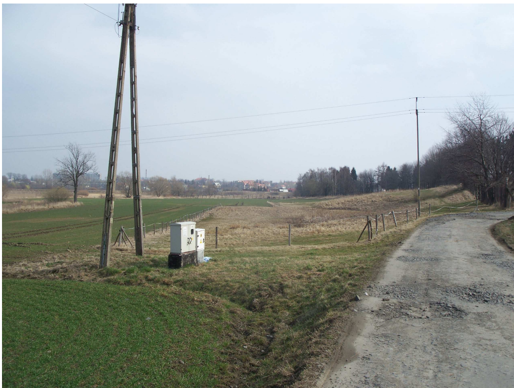
Ryc. 5 Ukształtowanie terenu – widok w kierunku zachodnim, w kierunku Ząbkowic Śl.