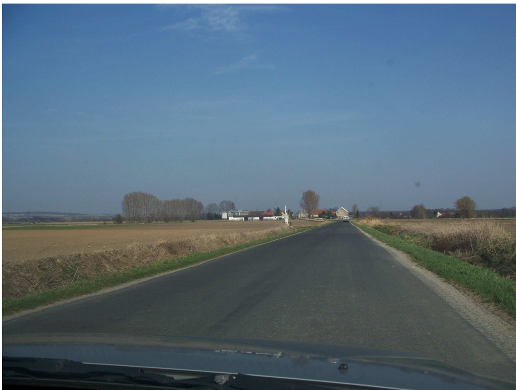
Ryc. 4 Ukształtowanie terenu – widok od strony zachodniej