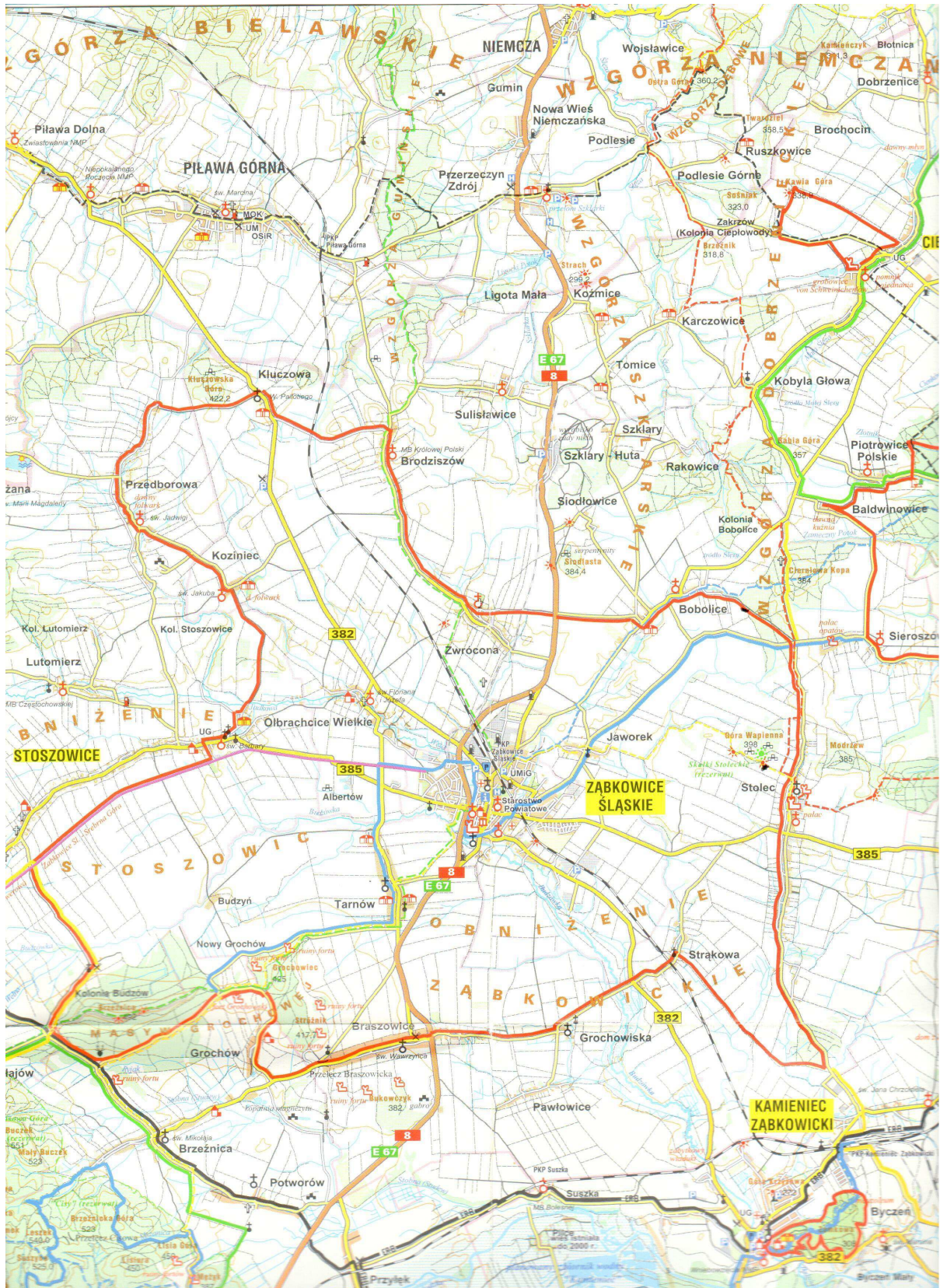
Ryc. 2 Grochowiska na tle Gminy Ząbkowice Śląskie