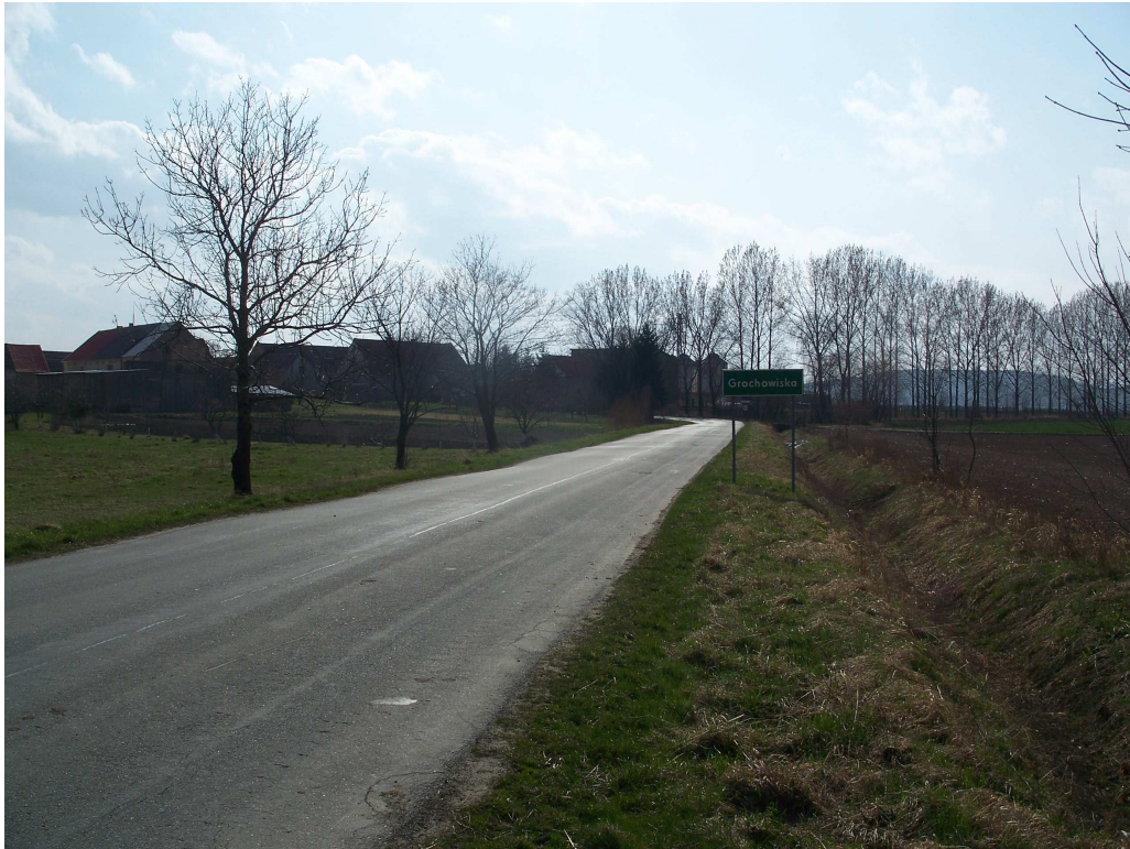
Ryc. 3 Ukształtowanie terenu – widok od strony północnej