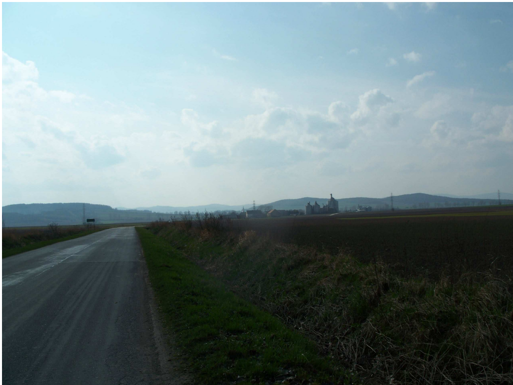
Ryc. 4 Ukształtowanie terenu – widok w kierunku zachodnim, na Braszowice Źródło: Fotografie własne (2013r.).